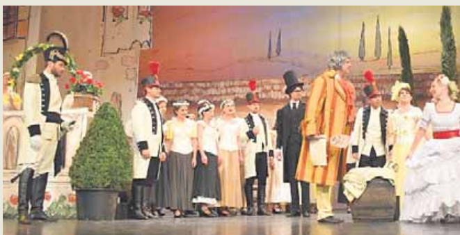
Herrliche Arien und spritzige Duette bezauberten am Freitag das Publikum.

bei einer Größe von 50 Zentimetern auf die Waage. Das „Zett“-Team gratuliert der frisch gebackenen Mama herzlich!